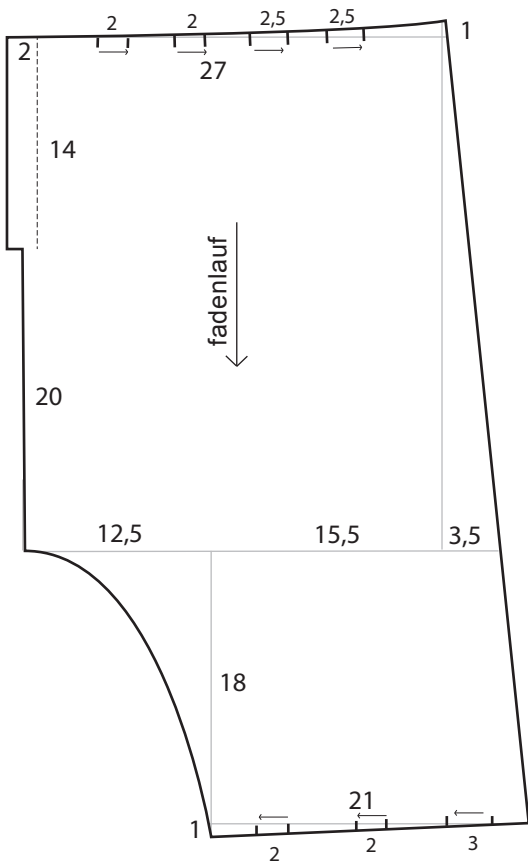
Hose hinten 1 cm Nahtzugabe enthalten 2 cm Saum enthalten